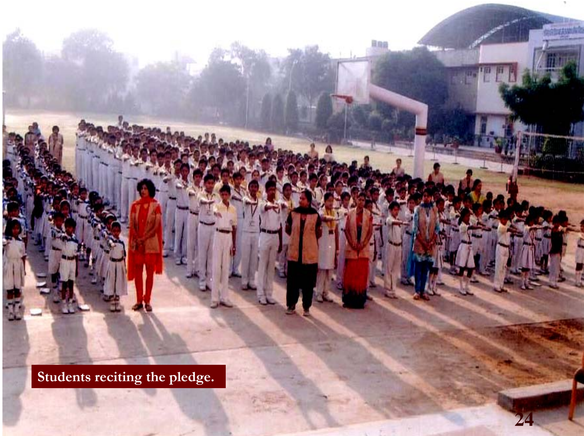
Students reciting the pledge.