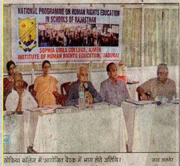
सोफिया कॉलेज में आयोजित बैठक में भाग लेते अतिथि।