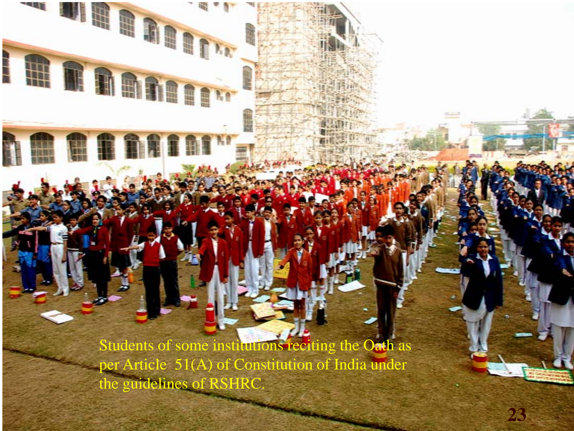
Students of some institutions reciting the Oath as per Article 51(A) of Constitution of India under the guidelines of RSHRC.